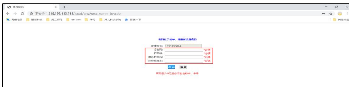
(首次登录修改密码)